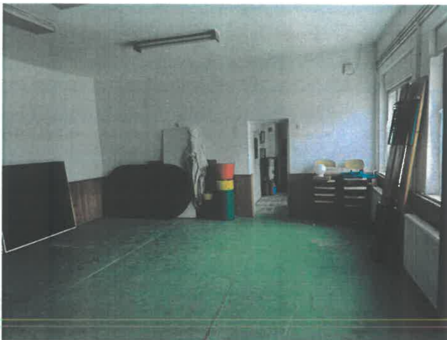
Nagy épület - konyha lenne: