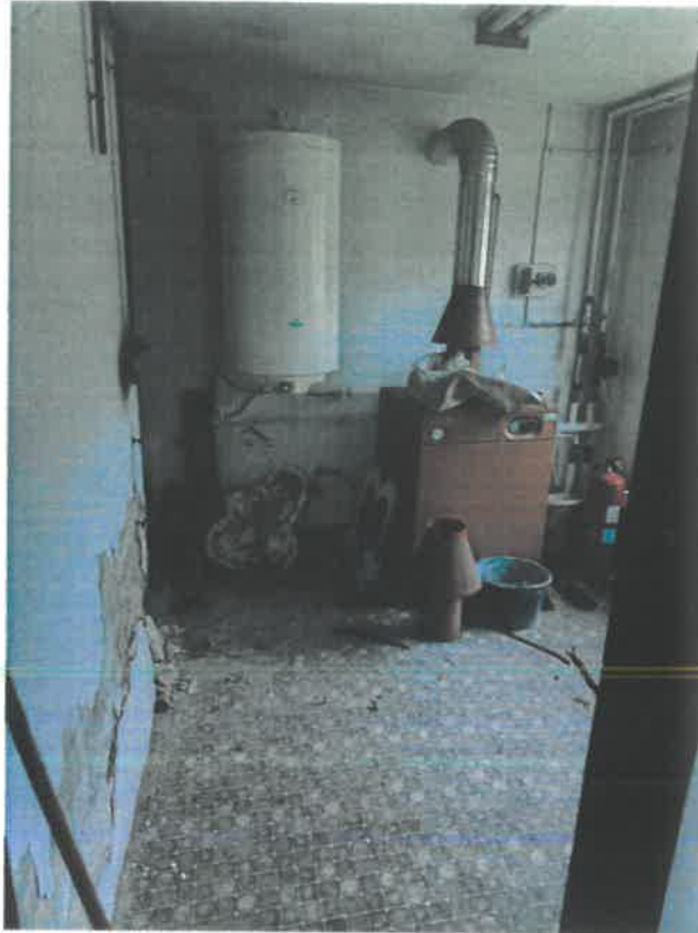
Kisépület, balra udvarfronti szoba ide érkezne a nagy épületből a lépcső: