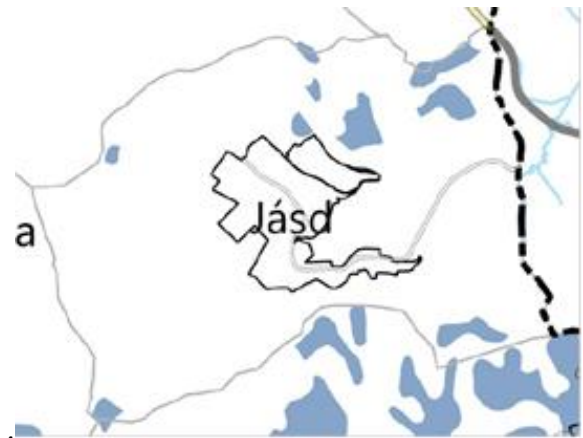
VMTrT – Vízminőség-védelmi terület övezete (VMTrT 3.6. melléklet)

Jásd területét az MvM rendelet 4. melléklete és a VMTrT 3.6. melléklete szerinti Vízminőség-védelmi terület övezete érinti. Az MvM rendelet 5.§-a értelmében a „vízminőség-védelmi terület övezetébe tartozó települések településrendezési eszközeinek készítése során ki kell jelölni a vízvédellemmel érintett területeket. A kijelölt vízvédellemmel érintett területekre vonatkozó egyedi szabályokat a helyi építési szabályzatban kell megállapítani” . továbbá az „övezetben bányászati tevékenység folytatása a bányászati szempontból kivett helyekre vonatkozó előírások alkalmazásával engedélyezhető” . A tervben a vízvédellemmel érintett területek ki lettek jelölve, a területekre vonatkozó szabályokat a HÉSZ tartalmazza. Az övezetben új bányaterület nem került kijelölésre.