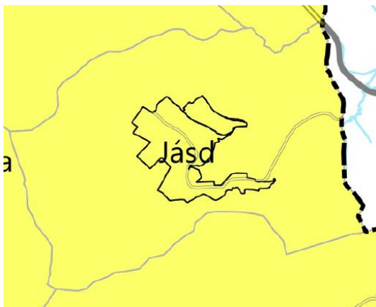
VMTrT – Az „Európa kulturális fővárosa Veszprém 2023” program érdekében együttműködő települések övezete (VMTrT 3.12.6. melléklet)

Jásd közigazgatási területén érvényesíteni kell a megyei TrT-ben meghatározott, a 3.12.6. mellékletben lehatárolt egyedi megyei övezet előírásait. Az övezet alá eső települések településfejlesztési dokumentumait az előírások értelmében összhangba kell hozni az „Európa kulturális fővárosa Veszprém 2023” programmal. A község 101/2020.(XI.30.) Kt. határozattal elfogadott Településfejlesztési koncepciója nem határoz meg a programmal ellentétes célokat és elveket.