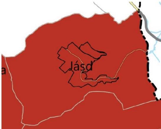
VMTrT – Turisztikai fejlesztések kiemelten támogatott célterületének övezete (VMTrT 3.12.4. melléklet)

Jásd közigazgatási területén érvényesíteni kell a megyei TrT-ben meghatározott, a 3.12.4. mellékletben lehatárolt egyedileg meghatározott megyei övezet előírásait. „Az övezet által érintett települések területén turisztikai-, rekreációs célú beépítésre szánt és beépítésre nem szánt különleges terület területfelhasználási egység akkor jelölhető ki, ha az új terület kijelölése nem érinti a védelmi övezetekkel lehatárolt területek (az ökológiai hálózat magterülete, az ökológiai folyosójának övezete, a kiváló termőhelyi adottságú szántók övezete, az erdők övezete, a vízminőségvédelmi terület övezete, valamint a nagyvízi meder övezete) által érintett területeket és nem ellentétes más jogszabály előírásaival.”