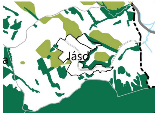
VMTrT – Erdők övezete és Erdőtelepítésre javasolt terület övezete (VMTrT 3.3. melléklet)

Jásd területét az MvM rendelet 2. melléklete, illetve a VMTrT 3.3. melléklete szerinti Erdőtelepítésre javasolt terület övezete érinti. Az MvM rendelet 3.§-a értelmében az erdőtelepítésre javasolt terület övezetének területén javasolt kijelölni az erdőterület területfelhasználási egységeket (a településfejlesztési és településrendezési célokkal összhangban). A terv csak olyan területeken jelöl ki erdőterületet, melyeken a természetben is erdő található, új, telepítendő erdőterületet a terv nem jelöl ki.