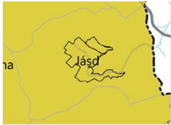
VMTrT – Tájképvédelmi terület övezete (VMTrT 3.4. melléklet)

Jásd területét az MvM. rendelet 3. melléklete és a VMTrT 3.4. melléklete szerinti Tájképvédelmi terület övezete érinti, amelynek területi kiterjedése megegyezik a BfNPI 2966-2/2020. ügyiratszámú levelében megküldött adatszolgáltatás lehatárolásával. A település teljes közigazgatási területe - így az összes módosítási pont - az övezet hatálya alá esik.