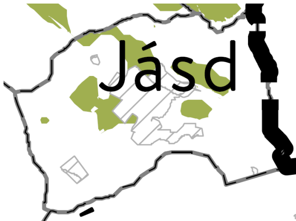
OTrT – Erdőtelepítésre javasolt terület övezete (MvM 2. melléklet)