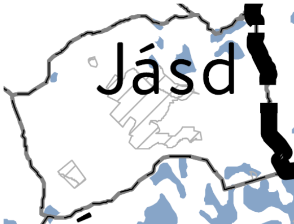
OTrT – Vízminőség-védelmi terület övezete (MvM 4. melléklet)