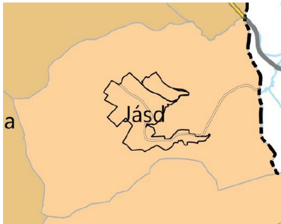
VMTrT – Veszprém megye várostérségeinek övezete (VMTrT 3.12.5. melléklet)

Jásd közigazgatási területén érvényesíteni kell a megyei TrT-ben meghatározott, a 3.12.5. mellékletben lehatárolt egyedi megyei övezet előírásait. Az övezet értelmében Jásd területe a Várpalota várostérségéhez tartozik. A településrendezési eszközök a várostérségre való kitekintéssel és a térségi tervek, fejlesztési igények összehangolásával készült.