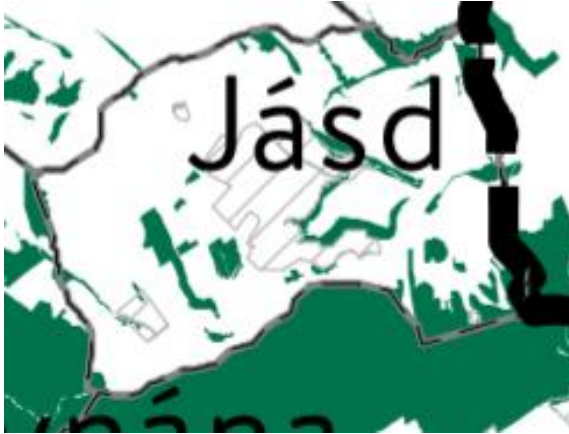
OTTrT – Erdők övezete (MaTrT 3/3. melléklet)