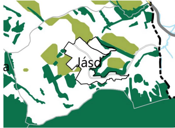
VMTrT – Erdők övezete és Erdőtelepítésre javasolt terület övezete (VMTrT 3.3. melléklet)

Jásd területét az MATrT 3/3. melléklete szerinti Erdők övezete érinti. Az MATrT 29.§-a értelmében az erdők övezetébe tartozó területeket az adott településnek a településrendezési eszközeiben legalább 95%-ban erdőterület területfelhasználási egységbe kell sorolnia, ahol figyelmen kívül hagyandók a törvény hatálybalépését megelőzően kijelölt beépítésre szánt területek és az Ország Szerkezeti Terve által kijelölt települési térség területei. Az alátámasztó munkarészekben igazolásra került, hogy a településszerkezeti tervben kijelölt erdőterületek az övezet lehatárolásának 99,29%-át fedik le , az övezettől való eltérés mindösszesen 1,05 ha.