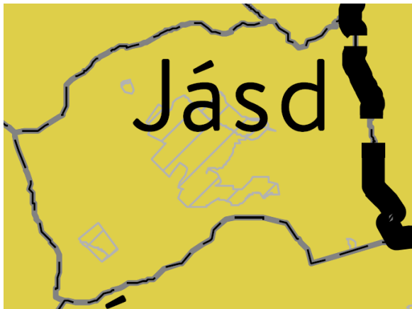
OTrT – Tájképvédelmi terület övezete (MvM 3. melléklet)