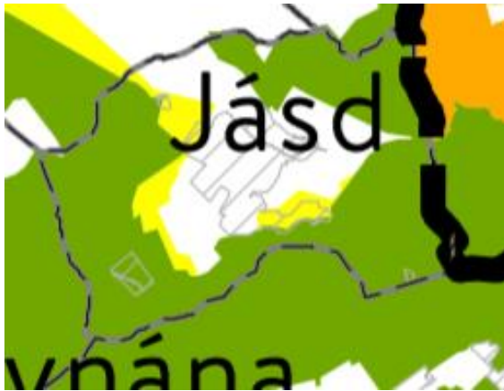
OTrT– Országos ökológiai hálózat övezete (MaTrT 3/1. melléklet)