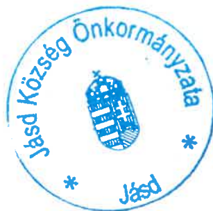
Győry Tünde polgármester

Handwritten signature of Győry Tünde in blue ink.